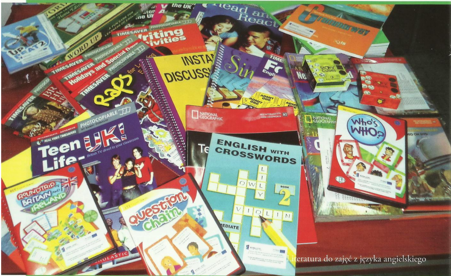
Literatura do zajęć z języka angielskiego

DOBRA EDUKACJA więcej szans na przyszłość