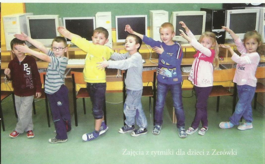
Zajęcia z rytmiki dla dzieci z Zerówki