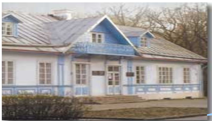
Dom E. Orzeszkowej w Grodnie